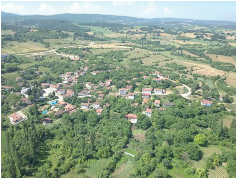
İlyas Bey Köyü Üstten Görünüm