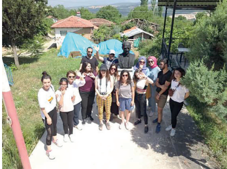
Atılım Üniversitesi Mimarlık Bölümü İlyas Bey Köyü Çalışma Ekibi

numu hem coğrafyası hem de topografik yapısından dolayı birçok güzelliğe ve özelliğe sahip bir köydür. İpek böcekçiliğinin neredeyse her evde yapıldığı, şerbetçiotu yetiştirildiği, barbunya, fasulye yetiştirildiği, hayvancılık için elverişli alanların olduğu düşünüldüğünde yeniden yaşatılması için bir çok sebebin olduğu görülmektedir.